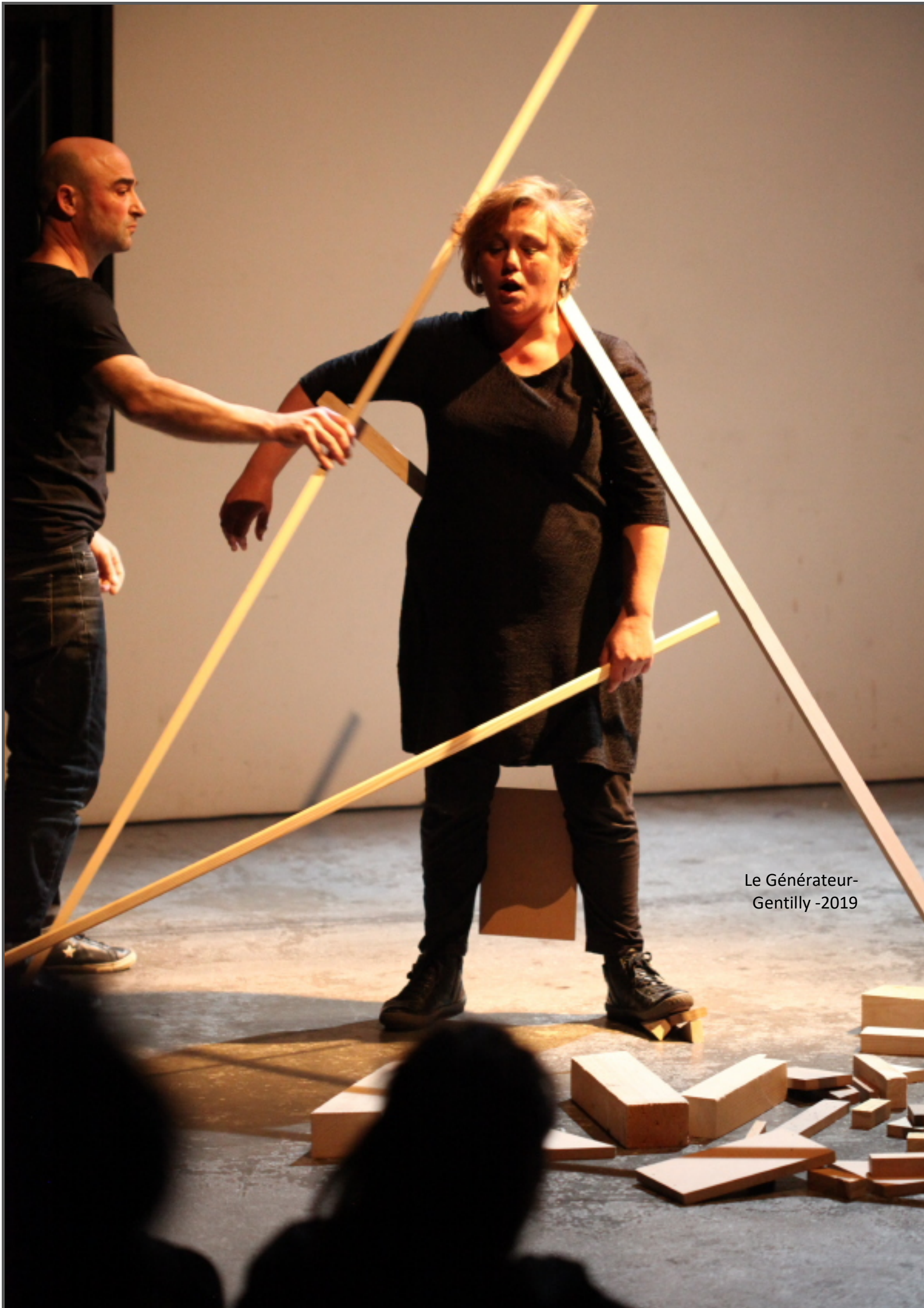
Le Générateur- Gentilly -2019